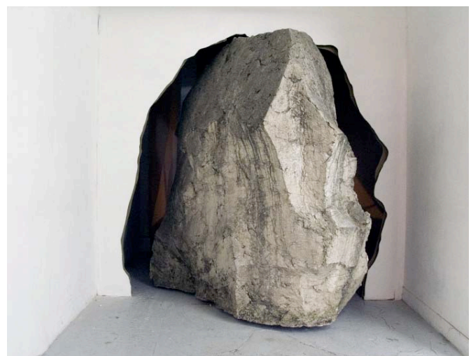
Passe Apache , 2005 Résine, bois, métal 246 x 246 x 100 cm (avec encadrement de porte) Pièce unique Collection FRAC Île-de-France, Paris © Stéphane Thidet