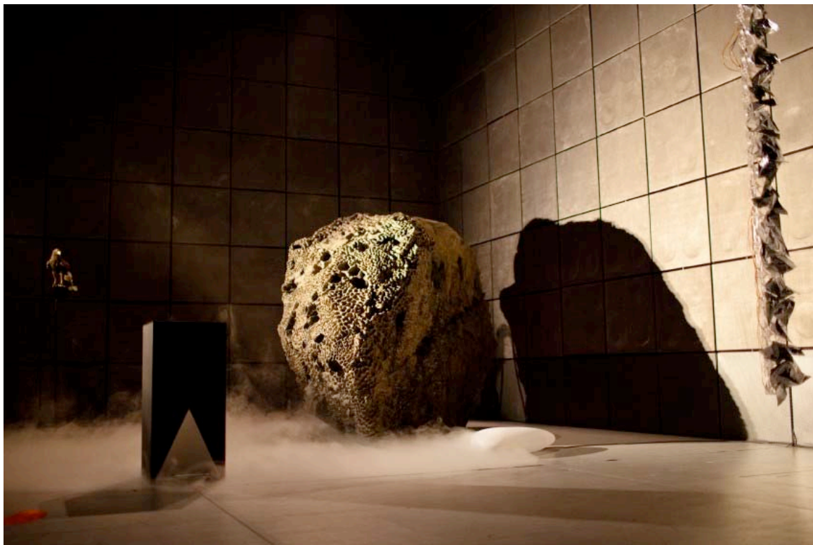
Ils traversent les pistes sur des morceaux de tissus pour ne pas laisser de trace Création de Virginie Yassef, spectacle pour enfants, La Gaîté Lyrique, 7-15 avril 2012.