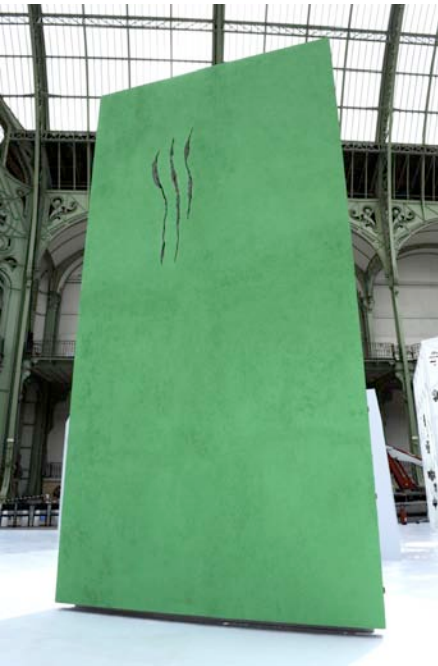
Il y a 140 millions d'années, un animal glisse sur une plage fangeuse du Massif Central , 2009