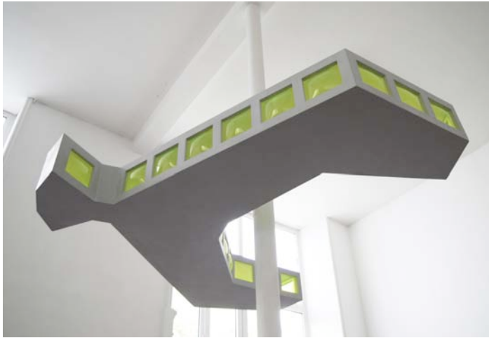
Airedificio , 2007 Technique mixte 191 x 240 x 210 cm Pièce unique