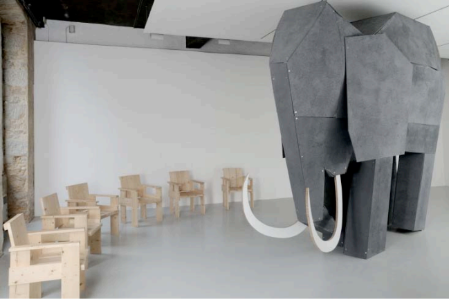
Pour la réveiller, il suffit d'un souffle , 2008

En 300 dpi sur demande : marjolaine.calipel@noisylesec.fr T : +33 (0)1 49 42 67 17 Vues d'exposition disponibles mi-décembre 2012