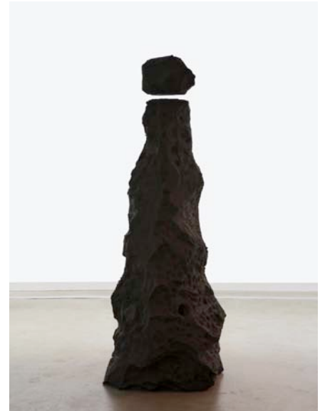
Bird's-eye view , 2010