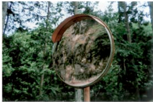
Scénario Fantôme 80 , 2010 2 épreuves chromogènes 6 x 9 cm chacune Édition de 1 + 1 E.A