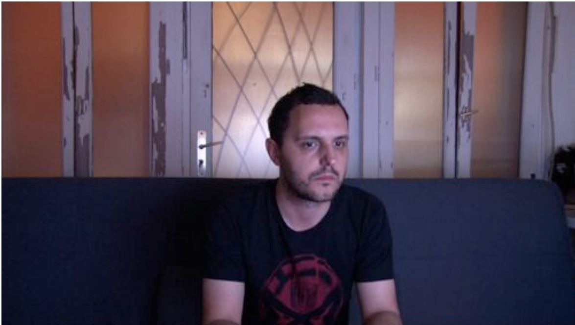
Call of Duty , vidéo HD, 16/9, sonore, plan séquence, 4h30, 2010 Musique réalisée par Olivier Cazin et Karl Otto Von Ortzen

Call Of Duty (d'après le titre d'un célèbre jeu vidéo de guerre) est un plan-séquence de 4h30mn d'un joueur de jeu vidéo.