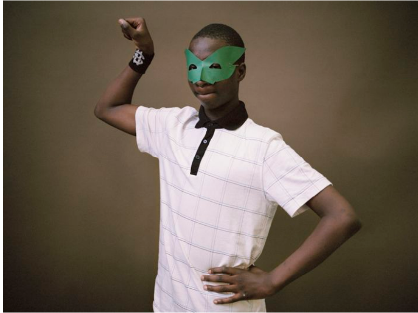
Green Lantern , tirage argentique, 24 x 30 cm, 2010