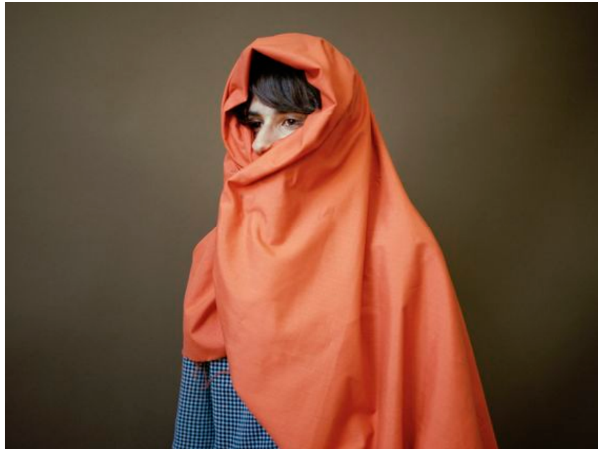
Kenny , tirage argentique, 24 x 30 cm, 2010

Dans cette série, l'artiste a réalisé le portrait d'adolescents reprenant à leur compte un élément unique du costume de leur héros favori. Cette série est composée de cinq portraits cadrés à mi-corps.